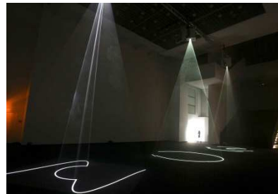
Anthony McCall « Solid light works »